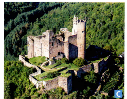
Doc. 1 Trois types de châteaux