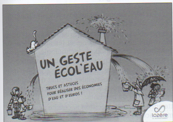
Doc. 5 Affiche de campagne de prévention pour un usage domestique raisonné de l'eau.

12. Qui sont les usagers de l'eau évoqués sur l'affiche ? Que font-ils ?